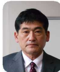
秋田整会長 (都北支会)