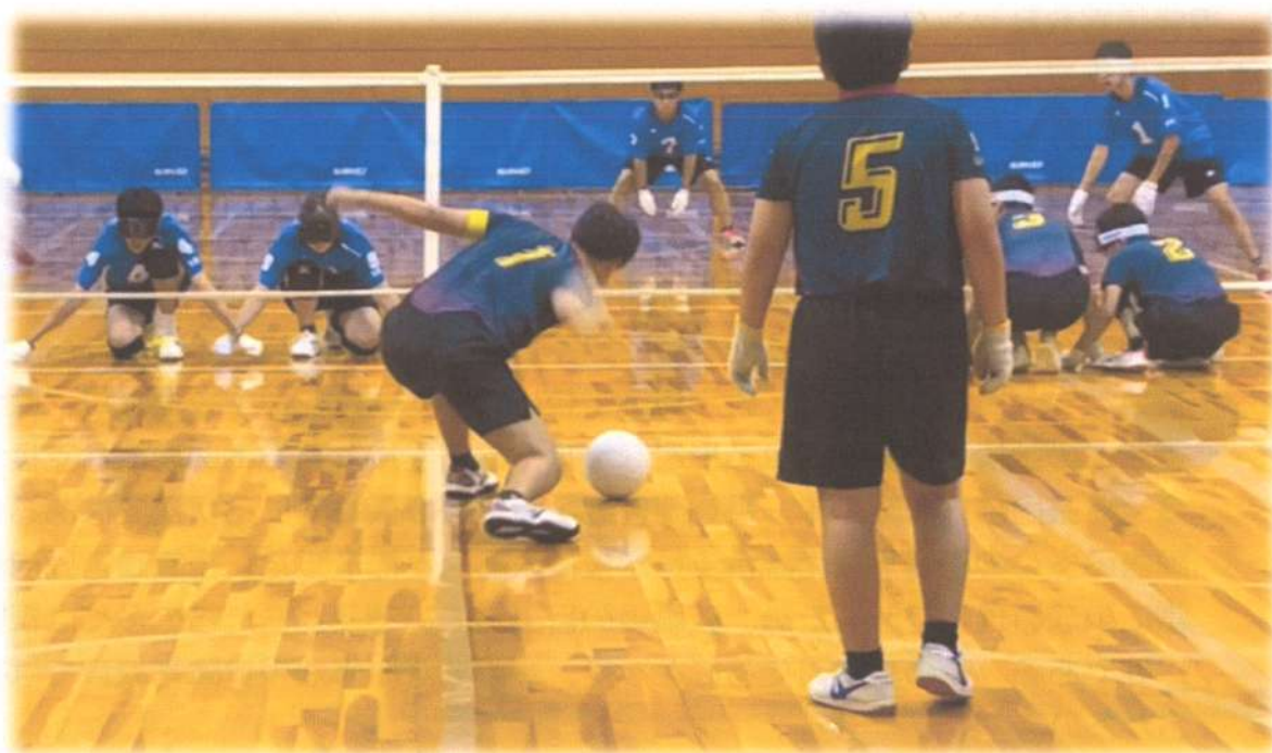
下関南総合支援学校 選手（キャプテン）のアタックの瞬間

第6回全国盲学校フロアバレーボール やまぐち大会 （下関南総合支援学校 主管大会）