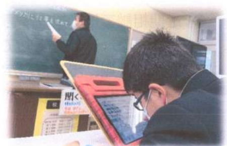
授業・デジタル教科書の活用(中1)

学部を越えて視覚障害教育センター担当教員が自立活動の授業に入り、児童生徒の指導、教員の支援を行った。必ずその日のことを担任にワンペーパーでフィードバックした。直接話をする時間がすぐにはなくても、後日内容を忘れずに話をすることができ、より良い指導に活かすことができた。即時のフィードバックで共通理解を図ることにより指導方法の違いが減り、生徒が安心して生活できるようになった。結果的に保護者からの問い合わせなども減ったように思われる。