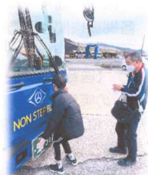
触察・バス外観を触る (小6)

視覚障害者にとって、公共交通機関は重要である。バスもその中の1つであるが、実際に利用するには困難が多い。実物に触れ体験させたくても、運行しているバスで触れさせることは難しい。そこで地元のバス会社に依頼し、バスを体感できる時間を設定した。児童生徒はバスの構造、押しボタンの位置、ICカードの読み取り機の場所、吊り輪、段差の位置など実物を丹念に見て理解を深めることができた。