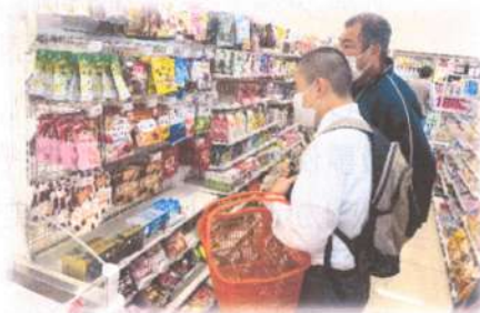
歩行指導・買い物(専保3)

視覚障害者にとって、歩行は大きな課題である。自立活動でも大きなテーマとして位置付けられることが多い。しかし、歩行についての具体的な支援については専門性が高く、誰でもすぐに指導できるものではない。下関南総合支援学校では、歩行訓練士を外部講師として招聘し、幼児児童生徒に実際に指導してもらいつつ、複数の教員がそれを見学することで、専門性の向上を目指している。