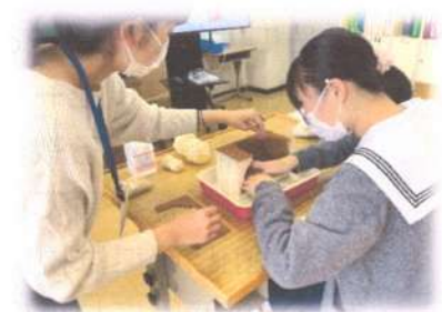
出前授業・模型を触る(高2)

下関市立考古博物館から、「ユニバーサルミュージアムの取組に協力してほしい」という依頼から連携がスタートした。視覚障害があっても分かる博物館にするため、下関南総合支援学校の視覚障害のある教員が実際に視察し、施設を改良していった。その取組の中で、児童生徒への出前授業を複数回行っ