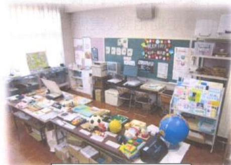
アイ・あい展示室

本校では「アイ・あい展示室」を設置し、視覚障害者が使用する教材教具や日常生活等で使用する便利グッズ等を展示・保管している。あわせて、展示室で教材教具を管理し、幼児児童生徒や教員の要請に応じ、期間の長短を問わず必要な物品の貸出を行っている。