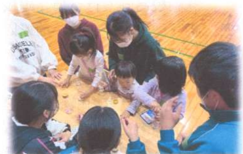
交流・チャレンジ教室(小学生)

毎年、下関南総合支援学校が県内の視覚障害がある幼児児童生徒へ呼びかけて実施している。視覚障害幼児児童生徒とその親のための交流会のようなものである。昨年度は11月3日に実施した。子どもに対しては大学生が企画したレクリエーションを、大人に対しては視覚障害のある教員や山口学芸大学門脇准教授を交えた子育てについての座談会を実施