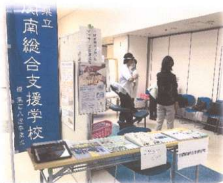
ロービジョンフォーラム・マッサージ体験(理療科教員)

平成28年に「やまぐちロービジョン勉強会」が発足した。本会は、山口県内の視覚障害者のQOL向上のため、ロービジョンケアの普及および発展に努め、会員相互の連携を図ることを目的としている。主として山口県内の眼科医、視能訓練士や看護師など医療従事者、教育および福祉関係者、企業従事者などが参加している。本校センター室からも役員としてボランティア参加している。定期的に勉強会を行い、専門性の向上や、理解啓発活動を行っている。また、「やまぐちロービジョンフォーラム」を毎年実施しており、下関南総合支援学校からも講演会講師や運営スタッフとして参加している。