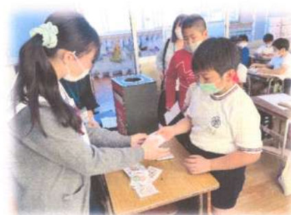
交流・高校生による 出前授業(高2)

下関南総合支援学校に一番近い小学校である生野小学校との交流をすすめ、昨年度は下関南総合支援学校の生徒が先生として、小学4年生に点字と点字ブロックについての授業を行った。それを受けて小学生が自分たちでできることを考え、ポスターを制作し、近所の郵便局に掲示する依頼を両校合同で行った。両校の関係が深まることで相互理解が深まり、地域にも広がる取り組みになった。